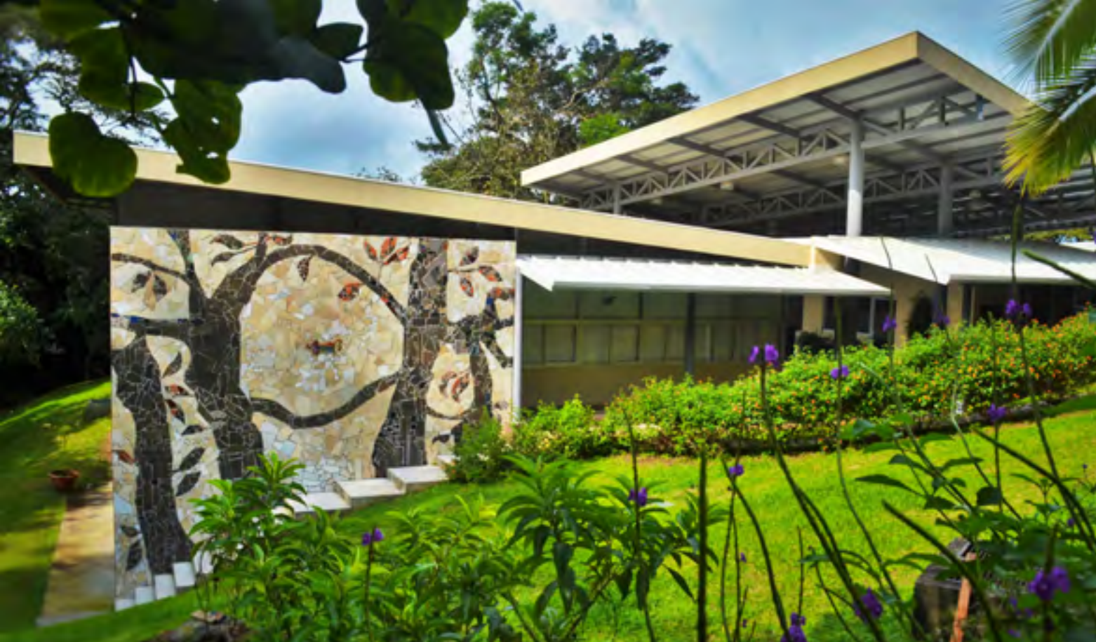
Instalaciones del Centro Carta de la Tierra de EDS.